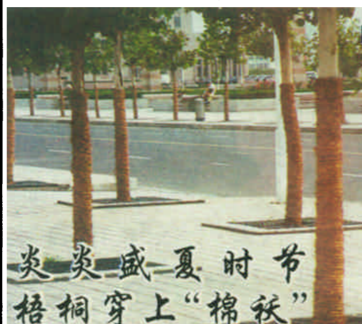
炎炎盛夏时节 梧桐穿上“棉袄”