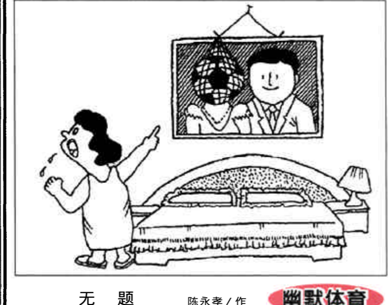
无题 陈永孝/作 幽默体育