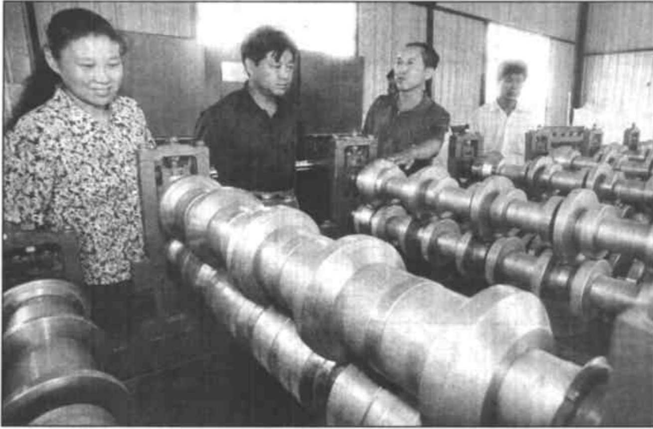
以利津县西营乡蔬菜专业合作联社为龙头，带动全县蔬菜生产。图中为西营乡蔬菜专业合作联社社员在田间劳作。

了《关于农村党支部和村委会工作中若干问题的规定》，对村“两委”的工作体制、重大村务的决策程序、村干部任免、村级财务管理及印章的管理和使用等作了严格规定。各乡镇结合实际，制定了具体的实施细则，并通过包村干部及时对掌握村级班子履行职责、执行议事程序和实行村务公开的情况，加强对农村干部的监督管理，对出现错误苗头的村干部谈话打招呼。村级健全村规民约、党员代表议事会、村民代表议事会和民主理财小组等，做到村级事务事事有人管、处处有章法，创造了健康向上的村风民俗。(胡伟 马成金)