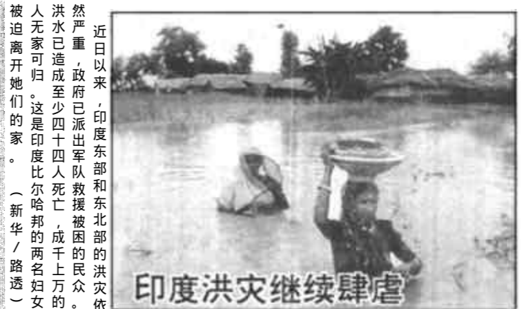
印度洪灾继续肆虐