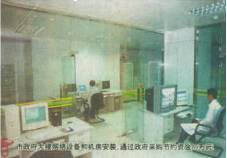
市政府大楼网络设备和机房安装，通过政府采购节约资金89万元

有关人士指出，我市作为一座新建城市，百业待举，前景广阔，包括基础设施、市政工程等在内的各个方面都在不断完善时期，政府采购工作可以说是大有可为。然而，由于我们是刚刚开始这方面的尝试，在很多方面还存在这样那样的不足，尤其是在人才和技术方面，更是存在很大程度的欠缺。如何壮大和优化政府采购队伍，总结经验，吸取教训，使这项“阳光作业”真正发