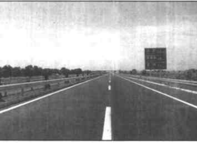
我市加大公路基础设施建设力度，到去年底，全市公路密度达到55.3公里/百平方公里，位居全省前列。目前，市直到所属县区均通一级路，过境省道无三级路，东青高速公路通车后将结束我市无过境高速公路的历史。

垦利讯 近日，一座由农民个人投资，群众无偿使用的蓄水30万方的中型水库在胜利镇坨南村建成。这座水库在坨南村建成50余万元，在村里修建了一座蓄水30万方的水库，从而保证了该村500余亩农田用水，同时还带动了生猪、养殖业等多种经营，年收入近10万元，逐步走上了富裕之路。但他致富不忘家乡，他取出了自己多年积蓄，加上外出多方筹措的资金，共50余万元，在村里修建了一座蓄水30万方的水库，从而保证了该村500余亩农田用水，同时还带动了生猪、养殖业等多种经营，年收入近10万元。(李树国 王金一)