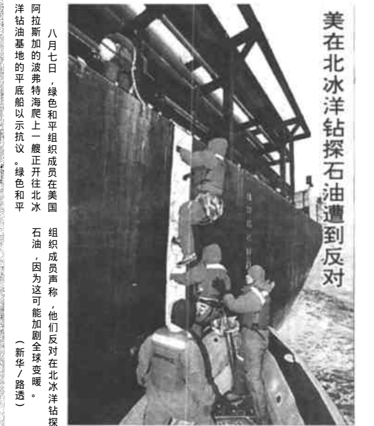
美在北冰洋钻探石油遭到反对