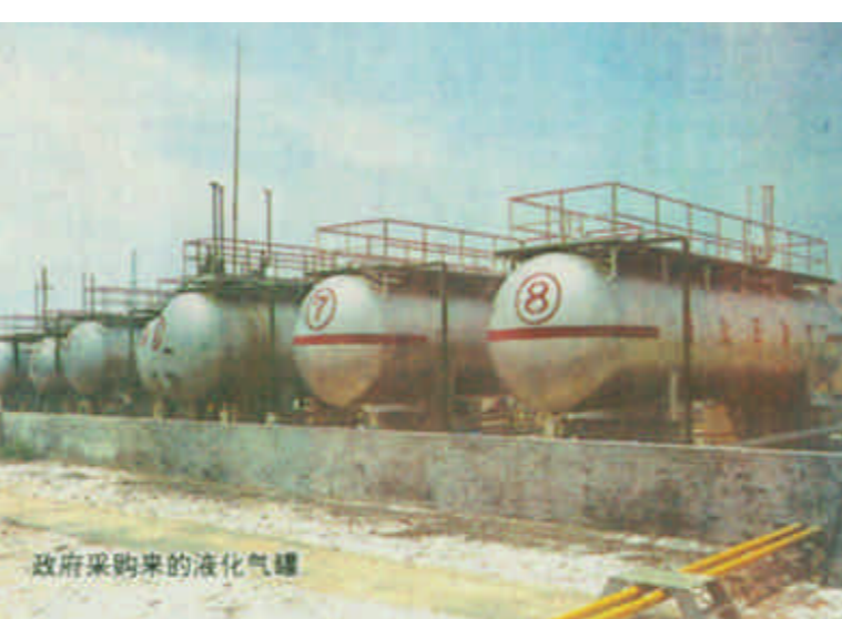
政府采购来的液化气罐

短短四个月的时间，政府采购办公室共发出标书和邀请函306封，举行竞争性谈判和招标投标会议27次，接待国内外供应商268家，签订购销合同39份，完成了市政给水材料、路灯设施、市政和开发区锅炉及安