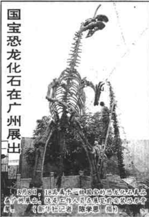
国宝恐龙化石在广州展出

摊主们表示，市场兴旺主要是因为租金低廉，一般租两天就可以赚回成本。本版责任编辑 全兆阳